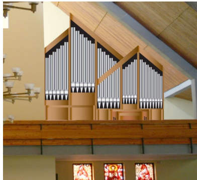
Jedna z propozycji usytuowania organów

Komitet Budowy Organów Adres e-mail: budujemyorgany@gmail.com Tel. 502 465 572 oraz 608 309 743 konto bankowe: PKO BP 80 1020 1127 0000 1102 0239 7131 z dopiskiem: na cele kultu religijnego - organy